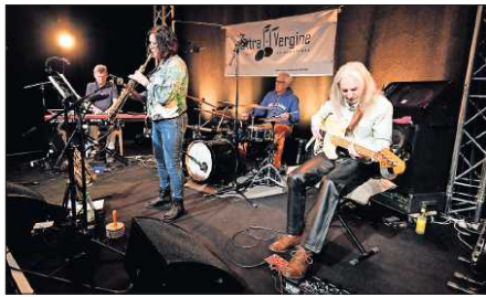
Starker Auftritt auf Einladung des Kaiserslauterer Vereins JAZZevau: das Extra Vergine Quartett.

tonatorisch mehr und die virtuos-geschmeidigen Skalenläufe von Dusemond lockerten zudem alles auf. Der Konzerterfolg basierte darauf, dass thematische Gedanken oder Episoden nicht stereotyp und endlos wiederholt werden, sondern dass daraus stets etwas Neues kontrastreich entsteht. Der Gedanke ans musikalische Menü bewahrheitet sich, man serviert leichte Kost zum Einhören mit mehrfach vorgestellten einprägsamen Riffs, und danach kommt etwas schwerer (fasslich) Verdauliches, wenn es mitunter auch mal kompliziert wird. Die klangliche Mischung und dynamische Ausbalancierung stimmt ebenso wie das Einhalten von Metrik und Rhythmik. Kurz: Das Extra Vergine Quartett sorgte für einen gelungenen Auftakt der diesjährigen Veranstaltungen. Als nächstes steht ein „Newcomer-Jazz-Workshop“ zwischen 12. und 14. April im Gymnasium am Rittersberg an. Infos und Anmeldung unter jazzinfo@jazzevau.de .